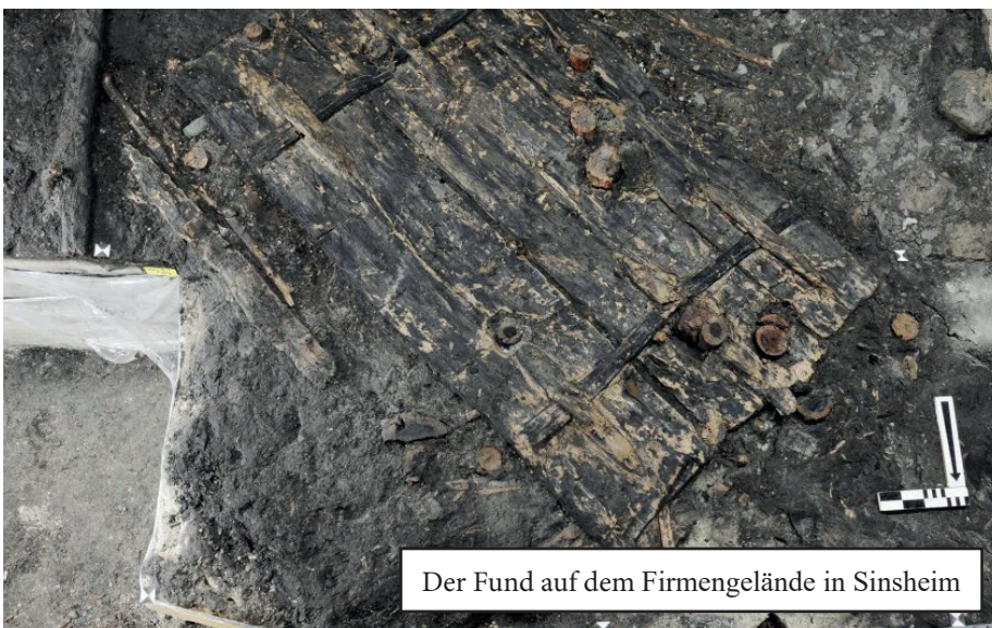
Der Fund auf dem Firmengelände in Sinsheim

Kurzfristig wurde auch eine Informations-Hotline für weitere Fragen eingerichtet, die bundesweit unter der Nummer 07265 / 91 10 93 erreichbar ist. Herr Mack beantwortet Ihnen hier Ihre Fragen.